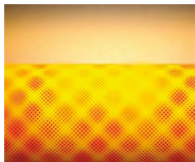
Palnik promiennikowy MatriX idealnie dopasowany do wymiennika ciepła