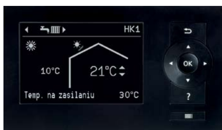
Wyświetlacz regulatora pompy ciepła Vitotronic 200