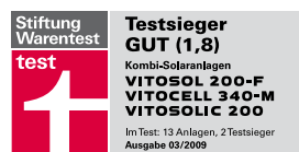
Doskonała jakość, której mogą Państwo zaufać. Więcej informacji pod adresem: www.test.de