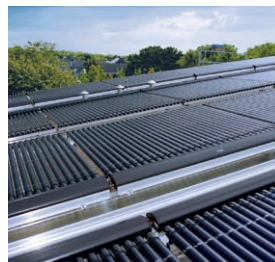
Vitosol 200-T położone bezpośrednio na dachu płaskim.

Vitosol 200-T jest wysokowydajnym kolektorem rurowym, który działa na zasadzie heatpipe i jest przeznaczony do montażu w dowolnym położeniu.