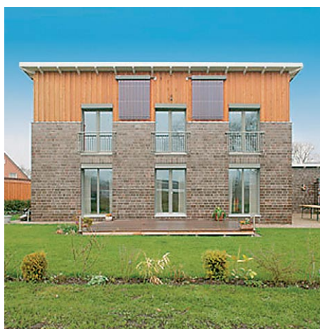
Kolektory słoneczne Vitosol 200-T powieszono pionowo na ścianie budynku.