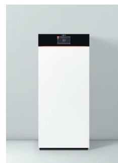
Vitodens 222-F, typ (B2TH)