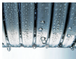
Wymiennik ciepła Inox-Radial

Odporny na korozję wymiennik ciepła Inox-Radial wykonany ze stali szlachetnej jest sercem kotła kondensacyjnego Vitodens 222-F. Przemienia on efektywnie energię spalania gazu w ciepło - praktycznie bez strat, z wysoką sprawnością wynoszącą aż 98%. Wyróżnia się przy tym niezawodnością i trwałością właściwą dla wysokiej jakości stali szlachetnej.