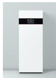
Vitodens 222-F, typ (B2SH)