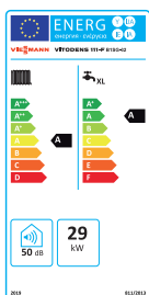
Etykieta klasy efektywności energetycznej (ErP) kotła Vitodens 111-F typ B1SG-32

Kompaktowy, stojący kocioł Vitodens 111-F z zabudowanym podgrzewaczem c.w.u. to idealne połączenie efektywnej techniki kondensacyjnej z wysokim komfortem wody użytkowej.