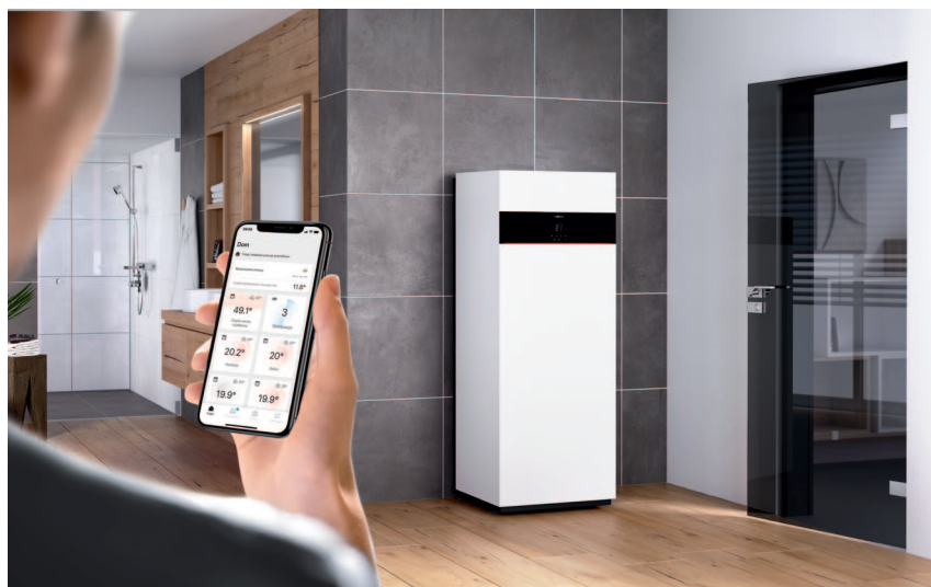
Komfortowa obsługa kotła Vitodens 111-F aplikacją mobilną ViCare pozwala na oszczędzanie energii.

Vitodens 111-F to atrakcyjna cenowo kombinacja efektywnej, gazowej techniki kondensacyjnej z wysokim komfortem podgrzewu ciepłej wody. Gazowy, kompaktowy kocioł kondensacyjny Vitodens 111-F został zaprojektowany z myślą o instalacjach poddawanych modernizacji, do zastąpienia starych, gazowych kotłów grzewczych. Wyposażony jest w wysokoefektywną pompę obiegową z regulowanymi obrotami, która pracuje nadzwyczaj cicho i z minimalnym poborem energii elektrycznej. Nowoczesna kompaktowa centrala grzewcza spełnia najwyższe wymagania, stawiane efektywnemu systemowi zaopatrzenia w ciepło. Zintegrowany 130-litrowy emaliowany węzownicowy podgrzewacz pojemnościowy gwarantuje bardzo wysoki komfort korzystania z ciepłej wody użytkowej - wszystko w jednej obudowie.