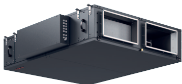
Vitoair FS PRO - o płaskiej konstrukcji przeznaczony do montażu na stropie (nad sufitem podwieszonym), podłodze lub ścianie.