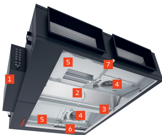
Vitoair FS PRO