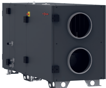
Vitoair CS PRO - przystosowany do instalacji wewnątrz i na zewnątrz budynków