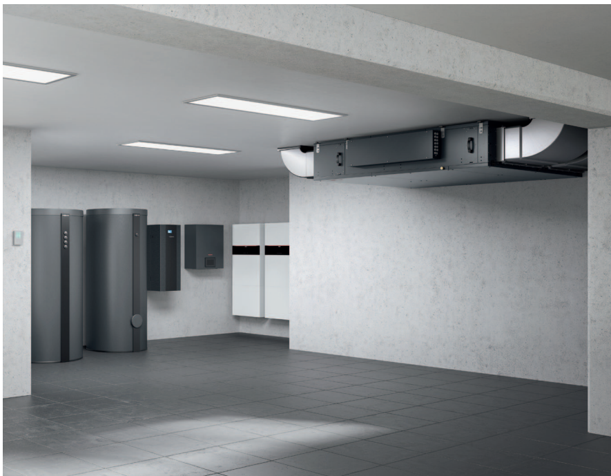
Wyjątkowo mała wysokość montażowa i kompaktowe rozmiary są bardzo ważne przy ograniczonej ilości miejsca do instalacji Vitoair FS PRO.

Seria Vitoair PRO to nowe, wysokowydajne rozwiązanie wentylacyjne, które równie dobrze nadaje się do biur, obiektów edukacyjnych, sklepów, miejsc spotkań i budynków mieszkalnych. Do mocnych stron central Vitoair PRO należy ponadprzeciętny odzysk ciepła, prosty montaż w sufitach podwieszanych dzięki smukłej konstrukcji (model FS PRO) oraz uruchamianie za pomocą aplikacji Vitoair PRO. Możliwe jest również krzyżowe połączenie innych produktów Viessmann.